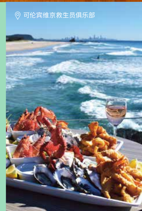
📍 可伦宾维京救生员俱乐部

“ 黄金海岸 已成为美食家的天堂 这里有精致的餐饮 和新鲜的美食 包括23家帽子餐厅 ”