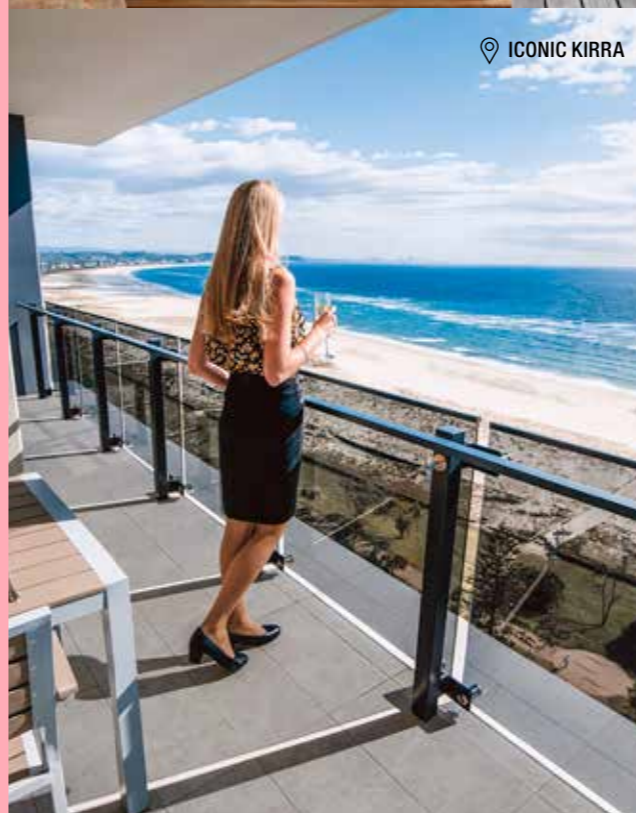
📍 ICONIC KIRRA