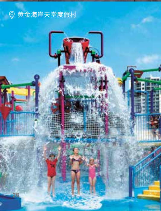
黄金海岸天堂度假村

Dorsett Gold Coast帝盛酒店位于黄金海岸的宽滩，它将城市活力和海滨度假完美结合，能让你在黄金海岸度过难忘的时光。酒店距离Kurrawa海滩仅700米，距离太平洋购物中心仅几步之遥，毗邻黄金海岸会议展览中心；在黄金海岸的黄金地段工作、娱乐和住宿，距离黄金海岸机场也仅30分钟。 dorsethotels.com