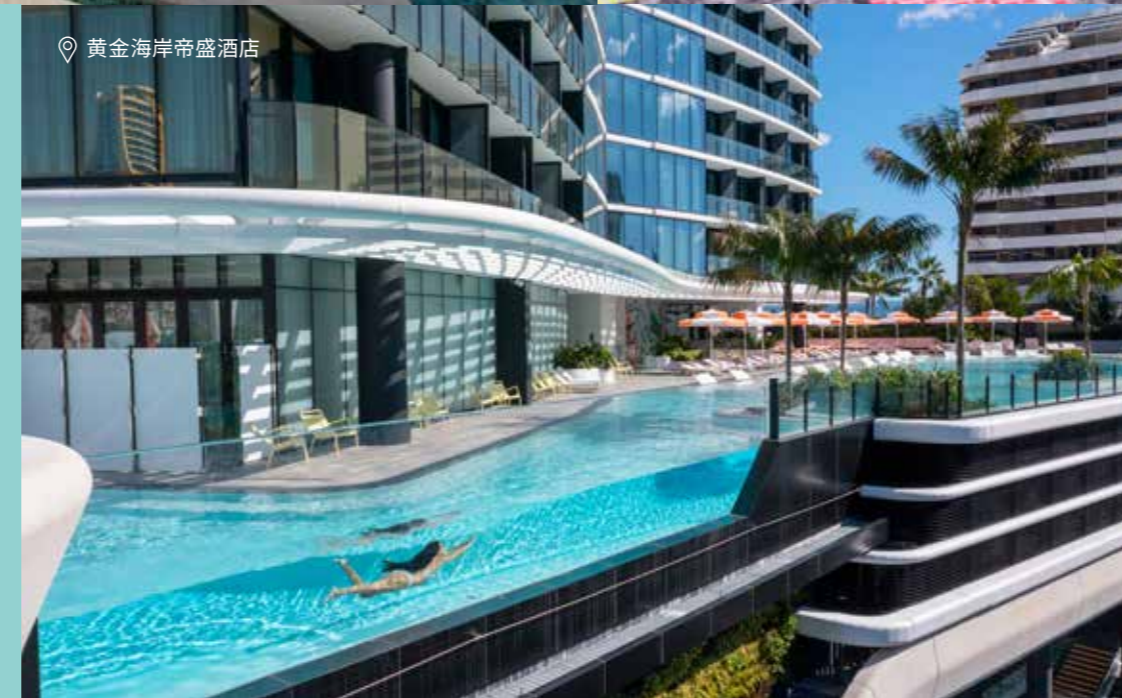
黄金海岸帝盛酒店