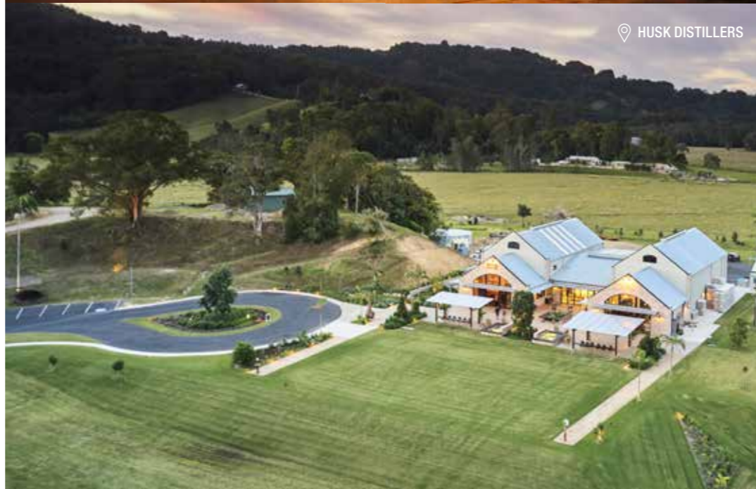
📍 HUSK DISTILLERS