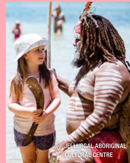
📍 JELLURGAL ABORIGINAL CULTURAL CENTRE