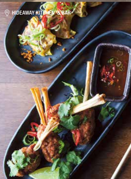
📍 HIDEAWAY KITCHEN & BAR

“ 黄金海岸 已成为美食家的天堂 这里有精致的餐饮 和新鲜的美食 包括23家帽子餐厅 ”