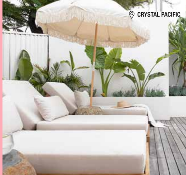
📍 CRYSTAL PACIFIC

这就像我的私人花园一样,无论是水上或者陆地,都有令人叹为观止的景色,它是一个适合各种水平的冲浪人群的好地方。不得不说,这个地方是相当特别。