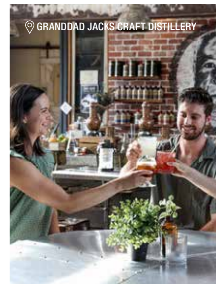
📍 GRANDDAD JACKS CRAFT DISTILLERY