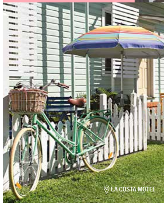
📍 LA COSTA MOTEL