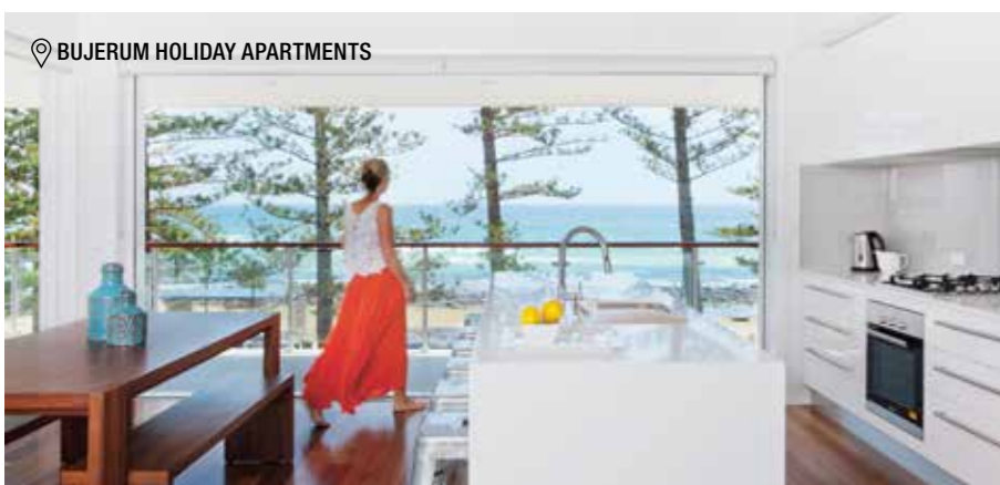
📍 BUJERUM HOLIDAY APARTMENTS