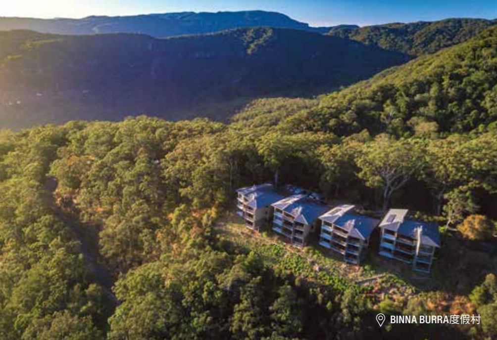
📍 BINNA BURRA 度假村